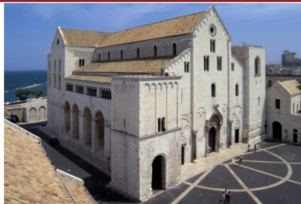
CATEDRALA SAN NICOLA DIN BARI